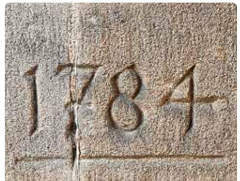
Overstromingsmarkeringen op de poort; de oudste is van 1784