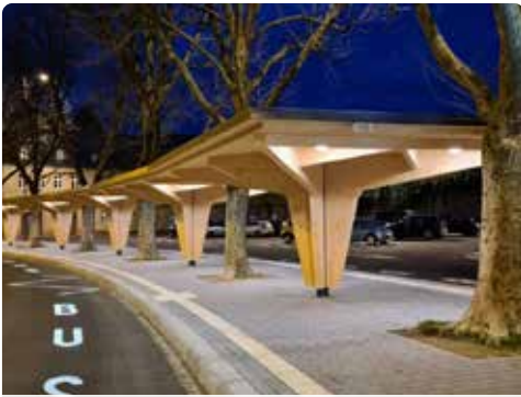
Heringerichte bushalte A Kack