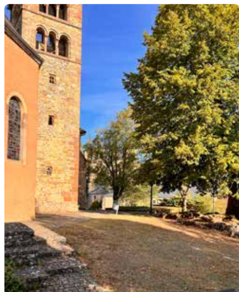
St. Petrus & Pauluskerk

In 2008 zijn de schilderingen in het gewelf uit de late Renaissance zorgvuldig geres-