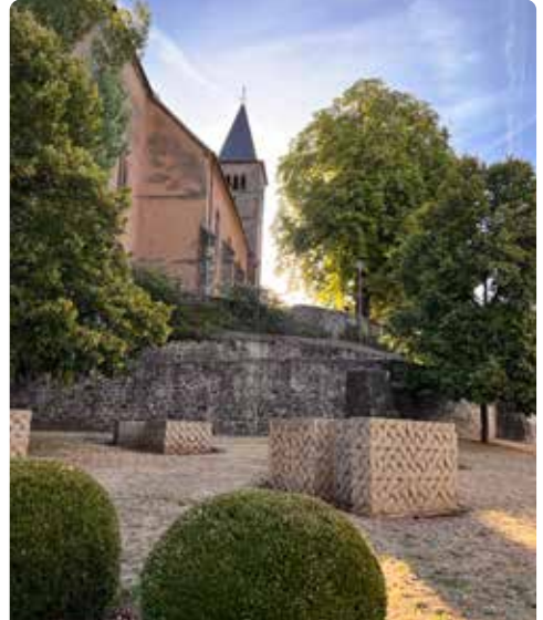
Irminaplein en St. Petrus & Pauluskerk

Ga over het trottoir naar de grote trap aan de linkerkant. Via deze trap komt u op de heuvel van St. Petrus en Paulus . Volg het voetpad dat in een boog om de kerk leidt.