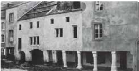
Voormalig raadhuis (1870/1880)

Bij renovatiewerkzaamheden (1895) werden aan de gevel standbeelden in neogotische stijl toegevoegd. Zij zijn het werk van de beeldhouwer Lambert Piedboeuf uit 1896; zij verbeeldde de vier hoofdeugden (wijsheid, dapperheid, matigheid en rechtvaardigheid). In het midden zijn de Moeder Gods en Koning Salomon te zien.