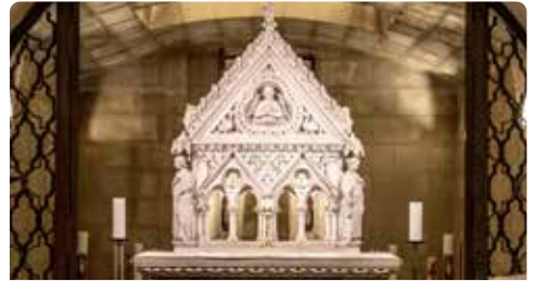
Graf van de heilige Willibrord (crypte)