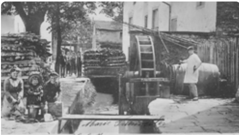
Bij de beek Kack

vanaf de twaalfde eeuw werd voor de verdedigingsmuur het veel stevigere materiaal steen gebruikt. De 2 km lange muur met vier poorten en veertien open schelptorens werd omgeven door een brede stadsgracht.