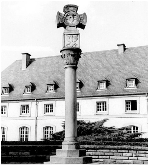
Gerechtigheidskruis voor de Basiliek (1955)

1374 kocht Wilhelm von Kerpen, abt en heer van Echternach, het gebouw om de administratie van de abdij in onder te brengen. Bij een grote brand in het jaar 1444 werd het gebouw vernietigd, maar daarna herbouwd. In 1520 werd het in Renaissancestijl verbouwd, wat goed zichtbaar is aan de grote raamkozijnen.