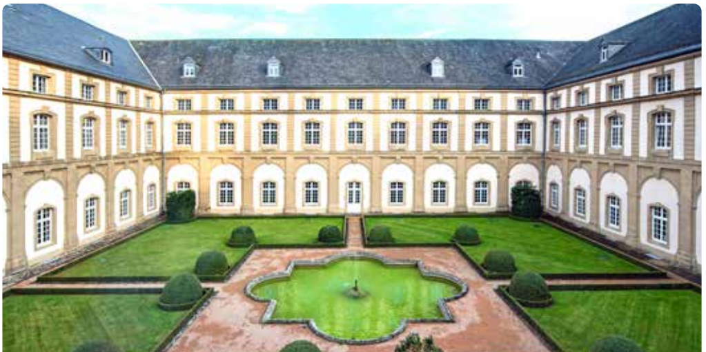
Franse tuin in het Abdijsgebouw

In de elfde eeuw was het scriptorium een favoriete leverancier van Keizer Hendrik III. In die tijd ontstonden enkele nu wereldberoemde werken zoals de Codex Aureus Epternacensis , dat zich sinds 1955 in het Germanische Nationaal museum in Nürnberg bevindt, de Codex Uppsaliensis , nu in de universiteitsbibliotheek van Uppsala in Zweden, en de Codex Aureus Escorialensis , die bewaard wordt in het Escorial bij Madrid. Deze handschriften worden ter bescherming nog maar zelden tentoongesteld. Facsimilés, dus nauwkeurige reproducties, maken het echter mogelijk om deze handschriften te bewonderen.