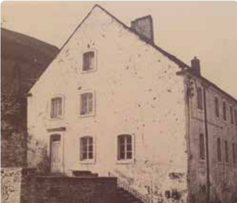
Hihof voor de restauratie in 1978

Vanaf het Hihof -gebouw loopt de route door de Rue des Tanneurs in de voormalige stadswijk Sack . Vandaar gaat het verder naar links onder de poort door naar de Rue du Pont . Vanaf hier heeft men zicht op de parkeerplaats A Kack .