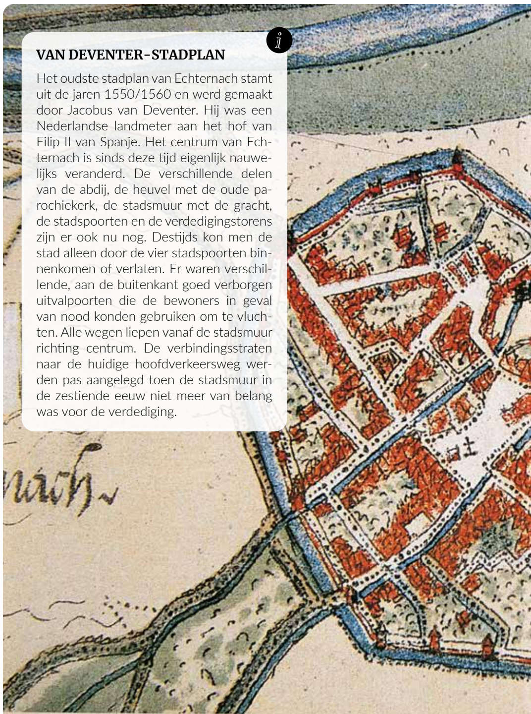
Oudste stadsplattegrond van Echternach, getekend door Jacobus van Deventer (1550/1560)