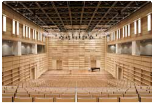
TRIFOLION Echternach (Hal Atrium)

Sinds 2008 is het cultuurcentrum TRIFOLION met tweehonderd evenementen per jaar een belangrijke plaats voor evenementen in Luxemburg en het grensgebied. Het gebouw staat op de plaats waar ooit een klooster van de redemptoristen stond en verwijst ook naar architectonische kenmerken van het voormalige klooster en zijn omgeving. Het TRIFOLION biedt uiteenlopende evenementen, van concerten en toneel tot aan events voor kinderen, dans, workshops, tentoonstellingen, lezingen en conferenties.