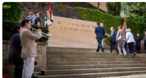
Nationale herdenkingsdag voor de slachtoffers van de Tweede Wereldoorlog

Telt men deze lettercijfers bij elkaar op, levert dat het cijfer 1945 op, het einde van de Tweede Wereldoorlog. Het inschrift betekent: HERREZEN UIT DE VERSCHRIKKELIJKE RUÏNES, WIJDT DE STAD HAAR NIEUW OPGERICHTE CI-TADEL AAN DE GEVALLENEN.