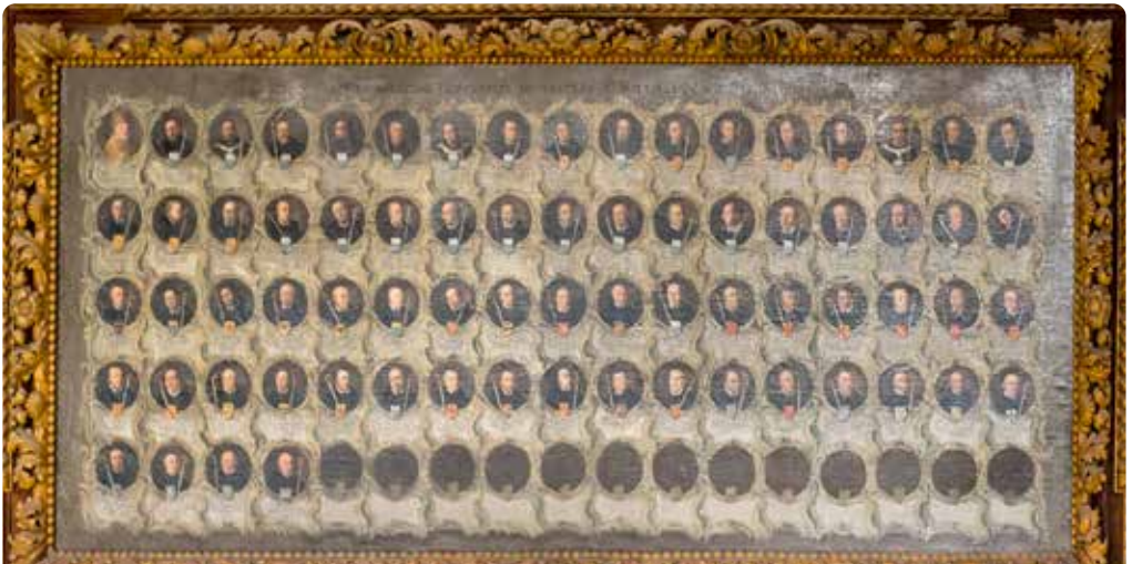
Abtencatalogus (gevestigd in de ontvangsthal van het huidige gymnasium)

In de daaropvolgende tijd werden delen van het gebouw gebruikt door het leger en verschillende fabrieken, totdat de gehele abdij door de staat werd opgekocht en als school werd ingericht. Na de Tweede Wereldoorlog werden delen van het complex bovendien gebruikt door de post