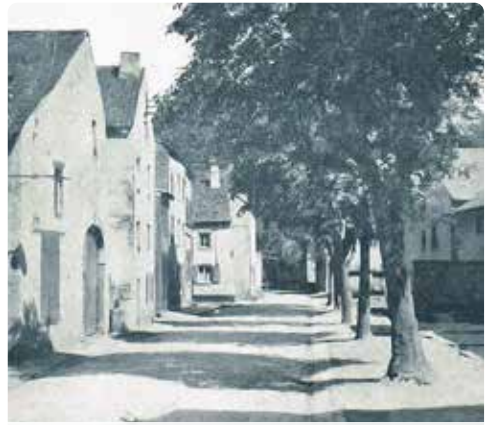
Voormalige stadswijk Kack