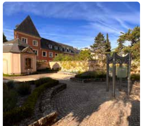
Parlodroom met barok tuinpaviljoen

Neem nu de kleine trap om af te dalen naar het eerste niveau, ga dan links weer een paar treden omhoog en volg daarna de trap rechts naar beneden naar de binnenplaats van de abdij. Volg onderaan de trap het pad naar links. Loop rond het vierkante deel van de abdij tot aan de Cour d'honneur (de binnenplaats voor de eervolle ontvangst) met de hoofdgevel.