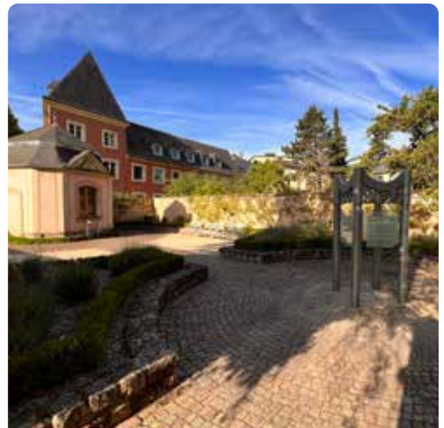
Parlodium mit barockem Gartenpavillon

Kehren Sie über die kleine Treppe zurück auf die erste Ebene, gehen Sie dann links wieder ein paar Stufen hoch und folgen Sie anschließend der Treppe rechts hinunter in den Abteihof. Am Fuß der Treppe geht es nach links. Das Abteiquadrum wird umrundet, bis zum Ehrenhof mit der Hauptfassade.