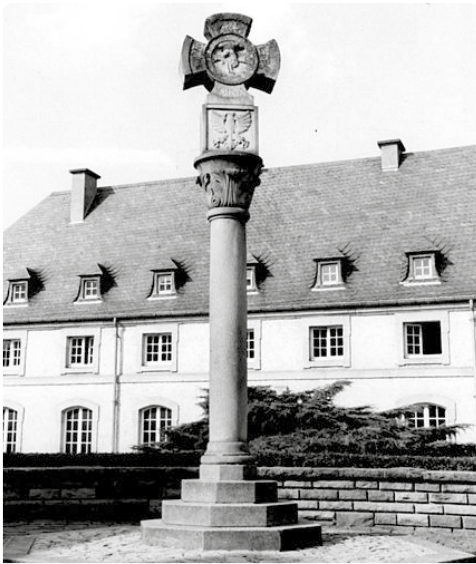
Justizkreuz vor der Basilika (1955)

zur Unterbringung der Abteiverwaltung. Bei einem großen Brand im Jahr 1444 wurde das Gebäude zerstört und anschließend wieder neu aufgebaut. 1520 wurde es im Renaissancestil umgebaut, was sehr gut an den großzügigen Fensterrahmen zu erkennen ist.