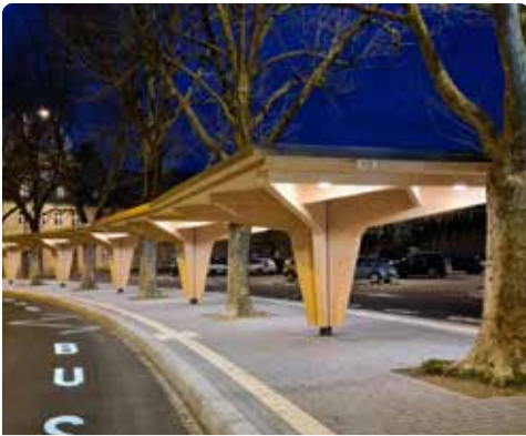
Neugestaltete Bushaltestelle A Kack