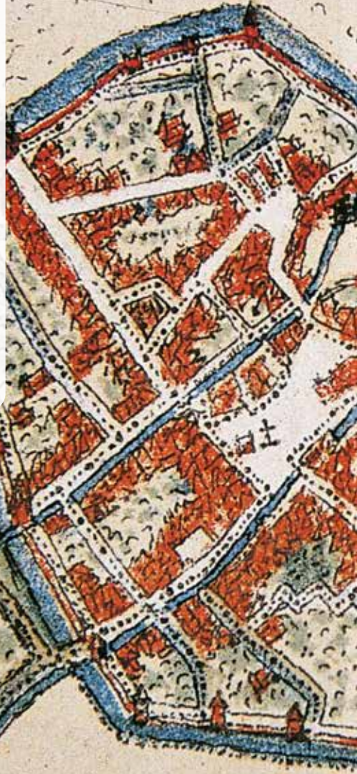
Ältester Stadtplan von Echternach, gezeichnet von Jacobus van Deventer (1550/1560)