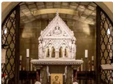
Grab des hl. Willibrords (Krypta)

Willibrord wurde 658 in Northumbrien (England) geboren und kam nach seiner Ausbildung im Kloster von Ripon nach Rath Melsigi in Irland, wo er zum Priester geweiht wurde. Im Jahr 690 brach er, von elf Gefährten begleitet, als Missionar auf, um das Evangelium auf dem Kontinent zu verkünden. 695 wurde er von Papst Sergius zum 1. Erzbischof von Utrecht geweiht. Dank einer Schenkung im Jahr 698 durch die Äbtissin Irmina von Oeren (Trier) konnte er in Echternach eine Abtei gründen. Nach einem erfüllten Leben als Missionar wünschte Willibrord in seiner Abtei in Echternach begraben zu werden. Er starb im Jahr 739 und ist in der Krypta der Basilika beigesetzt.