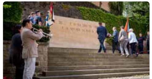
Nationaler Gedenktag in Erinnerung an die Opfer des Zweiten Weltkrieges

Die Summe dieser Zahlenbuchstaben ergibt die Zahl 1945, das Ende des Zweiten Weltkrieges. Die Inschrift lautet: AUS SCHRECKLICHEN RUINEN WIEDERERSTANDEN, WEIHT DIE STADT IHREN TOTEN DIE NEU GESTALTETE ZITADELLE.