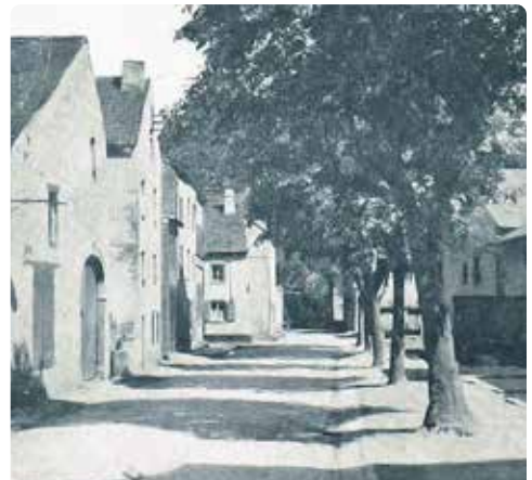
Ehemaliges Stadtviertel Kack

Der Platz wird begrenzt von den Überresten der ehemaligen Stadtmauer, deren Baubeginn vermutlich bereits auf das 9. Jh. zurückgeht, als die Abtei versuchte sich gegen feindliche Einfälle zu schützen. Als Baumaterialien wurden anfangs