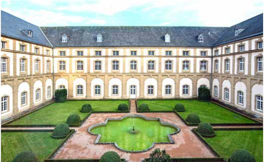
Französischer Garten im Abteigebäude

Von Anfang an gab es im Kloster ein Skriptorium, d.h. eine Schreibstube für die Herstellung von Büchern. Diese waren unentbehrlich für die Feier der Gottesdienste und die Ausbildung der jungen Mönche. Im 11. Jh. wurde das Skriptorium zum bevorzugten Lieferanten Kaiser Heinrichs III. Zu dieser Zeit entstanden einige heute weltbekannte Werke, wie der Codex Aureus Epternacensis , seit 1955 im Germanischen Nationalmuseum in Nürnberg, der Codex Uppsaliensis , heute in der Universitätsbibliothek in Uppsala in Schweden, und der im Escorial bei Madrid aufbewahrte Codex Aureus Escorialensis . Aus konservatorischen Gründen werden sie kaum noch ausgestellt. Faksimiles, d.h. originalgetreue Kopien, erlauben jedoch sie zu begutachten.