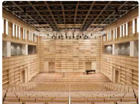
TRIFOLION Echternach (Saal Atrium)

Seit 2008 ist das Kulturzentrum TRIFOLION mit rund 200 Veranstaltungen jährlich eine wichtige Veranstaltungsstätte in Luxemburg und der grenzüberschreitenden Region. Das Gebäude wurde am Standort eines früheren Redemptoristen Klosters errichtet und greift architektonische Merkmale des ehemaligen Klosters sowie seiner Umgebung auf. Das Angebot des TRIFOLION reicht von Konzerten und Theater über Kinder-Events, Tanz, Workshops, Ausstellungen sowie Lesungen und Vorträgen.