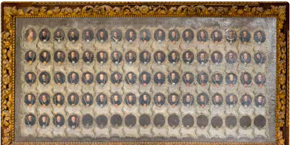
Äbtekatalog (befindet sich in der Ehrenhalle des heutigen Gymnasiums)

Nachdem Teile des Gebäudes vom Militär und verschiedenen Manufakturen genutzt wurden, wurde die Abtei komplett vom Staat aufgekauft und als Schule eingerichtet. Nach dem Zweiten Weltkrieg wurden die Räumlichkeiten zusätzlich von der Post und dem Steueramt genutzt. Heute beherbergt das Gebäude das Lycée Classique d'Echternach .