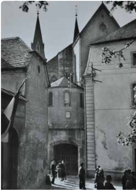
St. Willibrordus Brunnen