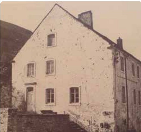
Hihof vor der Restaurierung 1978

Ab dem Hihof -Gebäude verläuft der Weg durch die Rue des Tanneurs im ehemaligen Stadtviertel Sack . Er führt nach links unter dem Torbogen hindurch zur Rue du Pont . Es öffnet sich der Blick auf den Parkplatz A Kack .