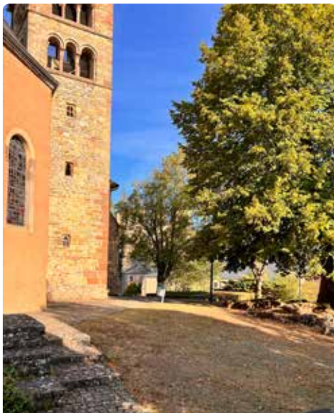
St. Peter & Paul Kirche

Gehen Sie weiter bis zum Hihof -Gebäude auf der rechten Seite.