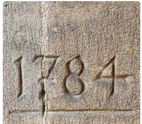
Hochwasser-Markierungen an der Pforte; die Älteste ist aus dem Jahr 1784