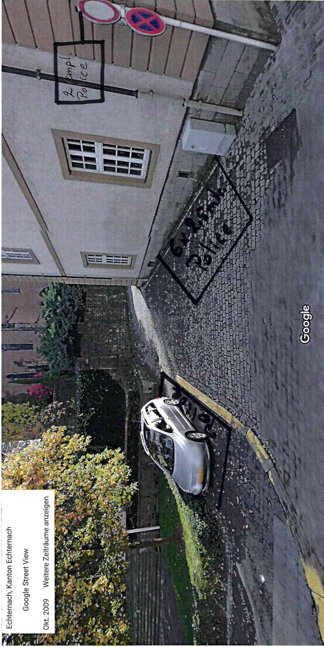
Echernach, Kanton Echernach Google Street View Okt. 2009 Weitere Zeiträume anzeigen